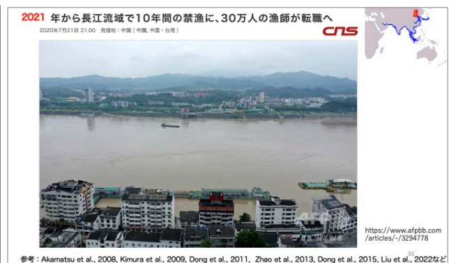
図4 環境悪化に対する大胆な政策例