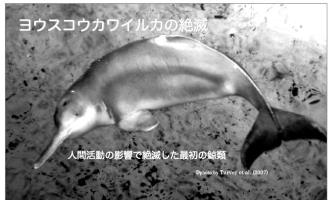
図2 ヨウスコウカワイルカの絶滅